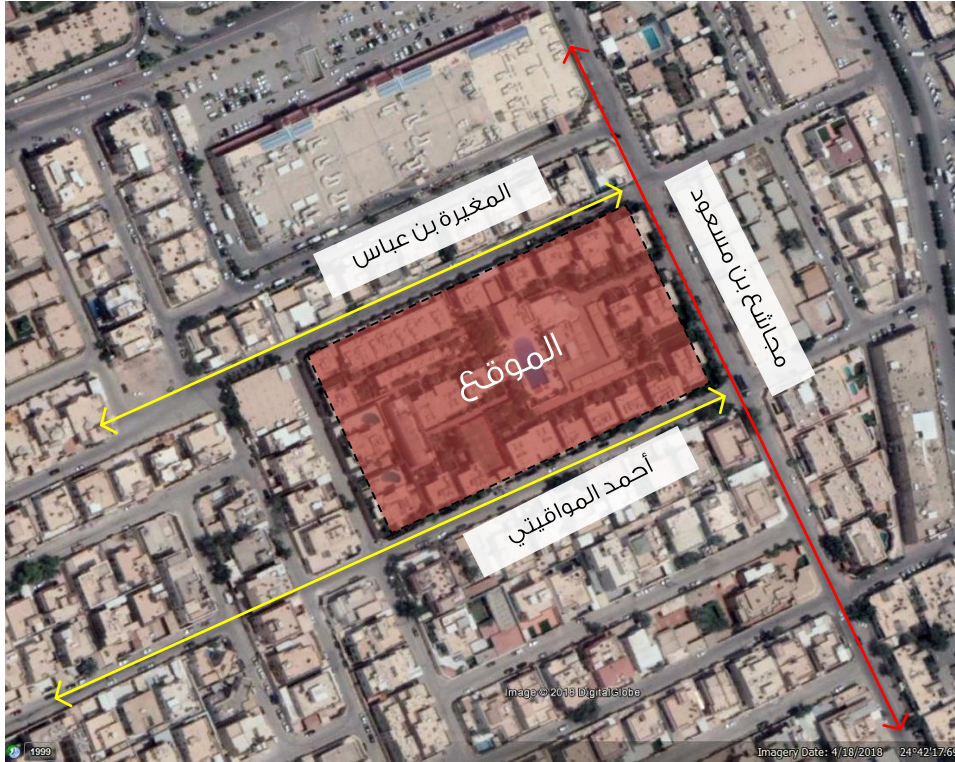
صورة توضح حدود العقار