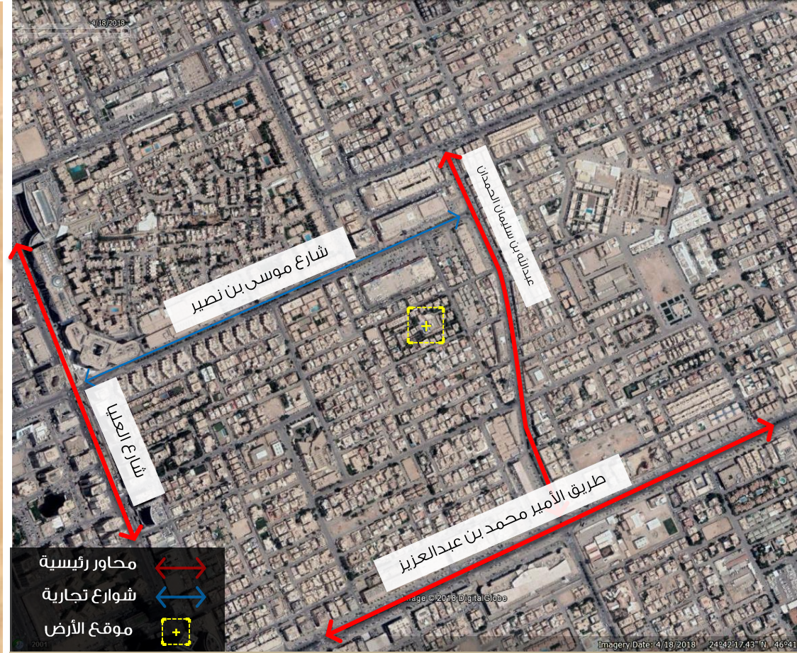
صورة توضح حدود العقار على مستوى الأحياء المجاورة